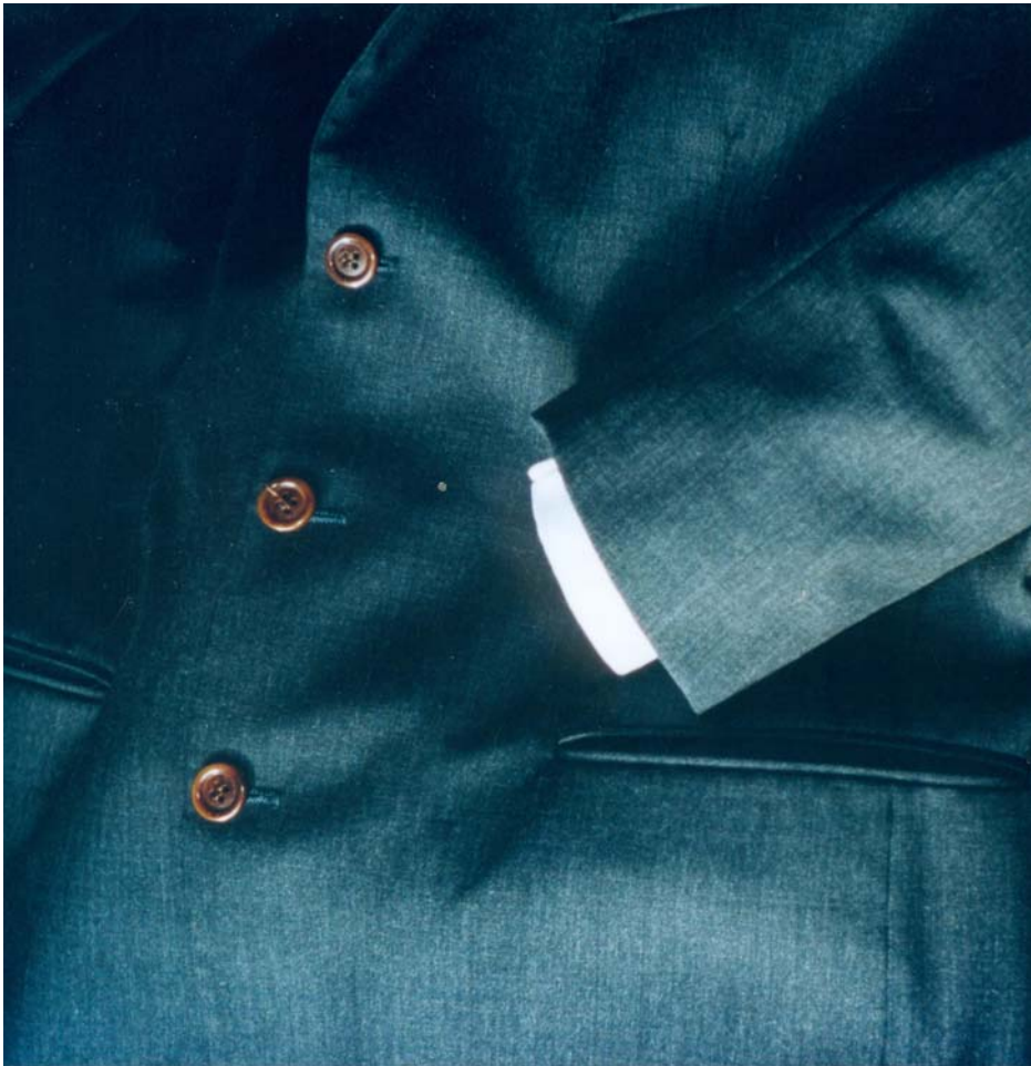
Abbildung 1: Die unsichtbare Hand (1999) des Konzeptkünstlers Arg de Triomphe